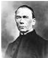
Adolf Kolping 08.12.1813 bis 04.12.1865