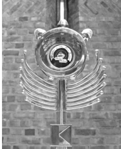
Monstranz mit einer Reliquie Adolph Kolpings aus der St. Laurentiuskirche, Wuppertal